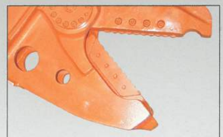
Couteaux de forme ondulée